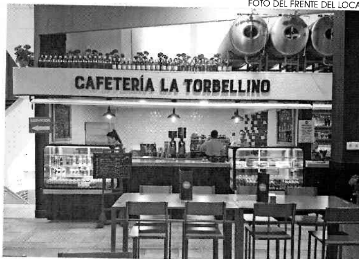
FOTO DEL FRENTE DEL LOCAL